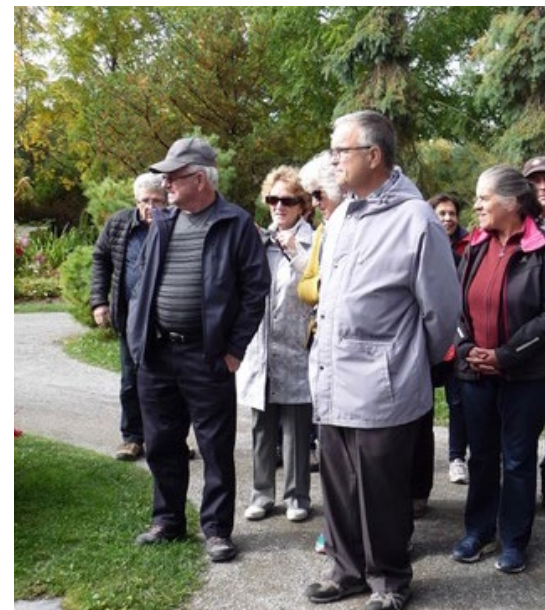
VISITE DE L'AQRP MAURICIE, LE 25 SEPTEMBRE DERNIER, AU PARC MARIE-VICTORIN DE KINGSEY FALLS.

De façon générale, je me suis attaché à la cause des personnes âgées qui vivent dans la solitude. Ce phénomène désolant m'a frappé quand je me suis occupé de ma mère. J'ai vu des gens dans le CHSLD