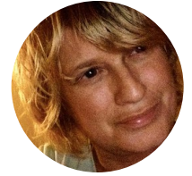
Par Linda Priestley Journaliste

PORTRAIT D'UN GÉOMORPHOLOGUE QUI A LES PIEDS SUR TERRE, MAIS QUI N'HÉSITE PAS À LAISSER S'ENVOLER SON IMAGINATION POUR RÉSOUDRE DES PROBLÈMES !