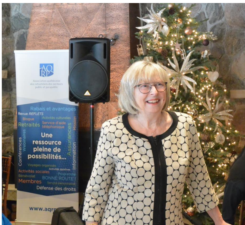
Un toast est porté pour fêter Noël