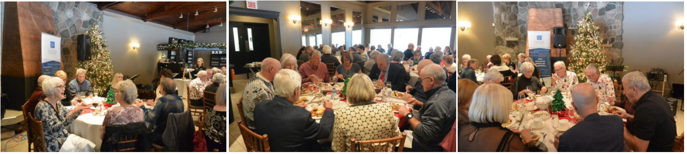
... avant que les Troubadours de Brandon ne nous mettent le cœur en fête