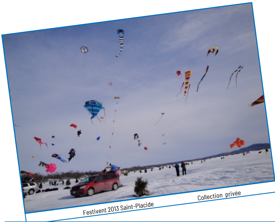
Festivent 2013 Saint-Placide