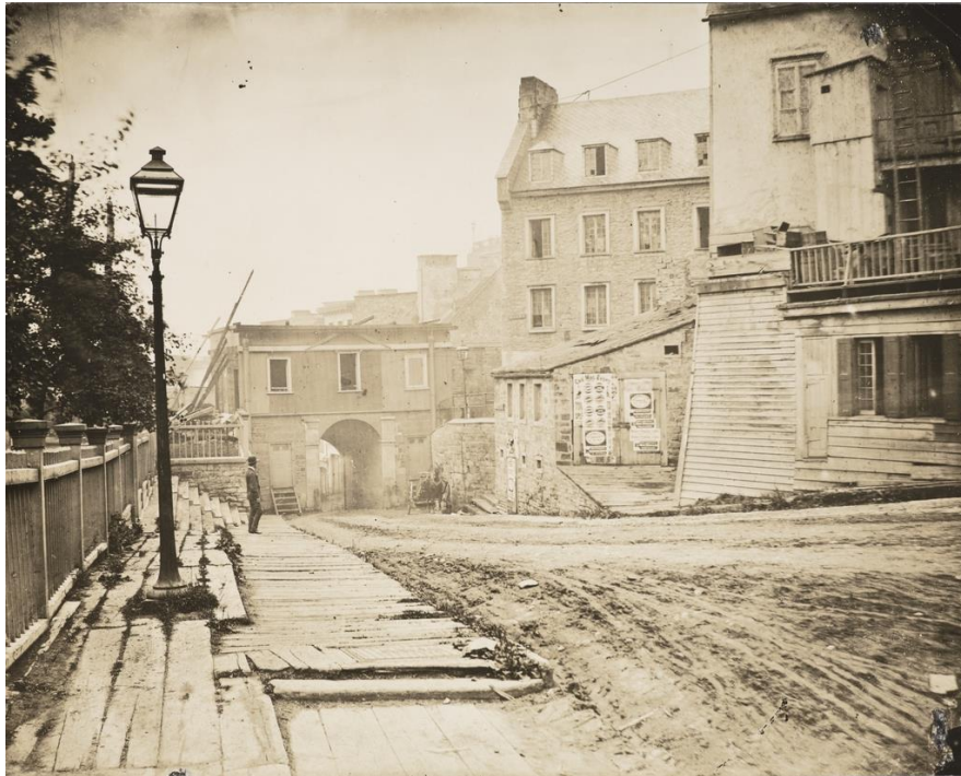
Livernois, vers 1870 (Épreuve à la gélatine argentique, MNBAQ)

Notre dernière énigme nous amenait à la porte de la Haute-Ville dans la côte de la Montagne, la porte Prescott. Les Français n'avaient pas jugé utile d'installer une porte pour contrôler l'accès à la ville de ce côté. Les Anglais vont en installer une pour se protéger des indépendantistes américains, et peut-être aussi des pacifiques hordes canadiennes-françaises de Saint-Roch, de Beauport, de Charlesbourg ou de Beaupré.