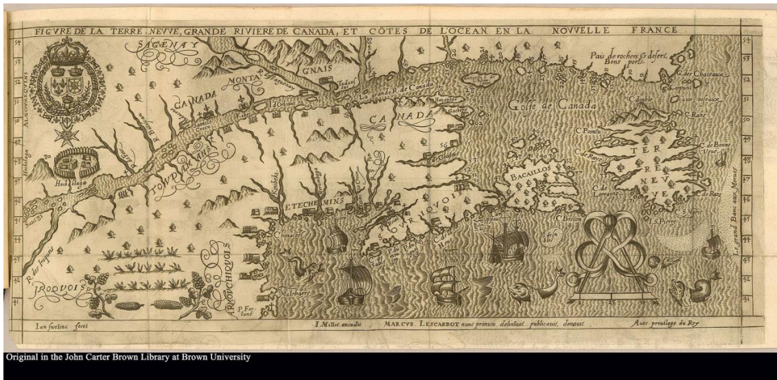
Figure de la Grande Rivière de Canada (qu'il n'a pas vue) (Marc Lescarbot, 1609)

saint Laurent ». Quand il s'avance enfin dans le fleuve l'année suivante, guidé par les Amérindiens, il le nomme fleuve de Hochelaga . Et c'est Champlain, finalement, qui, après avoir écrit la Grande Rivière de Canada dans ses premiers récits, a finalement adopté le grand fleuve saint Laurent . Ce faisant, on a évidemment ignoré que ce fleuve avait déjà un nom, ou plutôt plusieurs noms selon la langue de chaque nation amérindienne qui fréquentait ce fleuve.