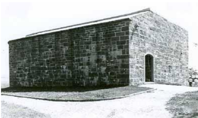
La redoute de Frontenac

À quelques mètres de nous, à notre droite, le bateau des Terrasses du Vieux-Port. Ce sont deux bâtiments reliés par un toit de verre, avec jardin et chute d'eau à la base. Le bateau de croisière, quoi ! L'un ou l'autre appartement est à vendre en ce moment. Intéressés ? Dans les 400 000 $ selon l'étage et la vue.