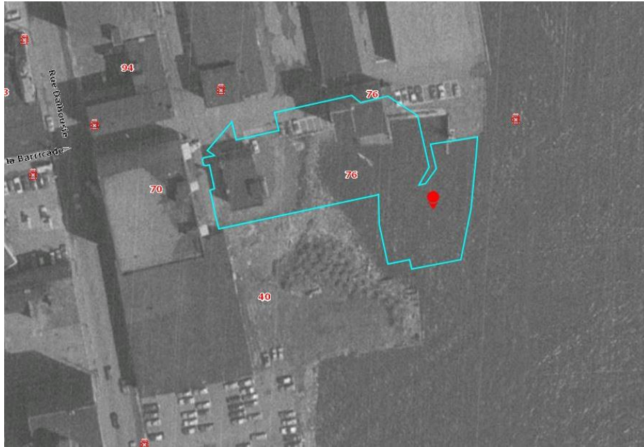
La rue Dalhousie traverse la photo à gauche 2 .

Jean-Simon Gagné a déjà qualifié les Terrasses de gros thon parachuté dans le désert (Le Soleil, 19.10.2019).