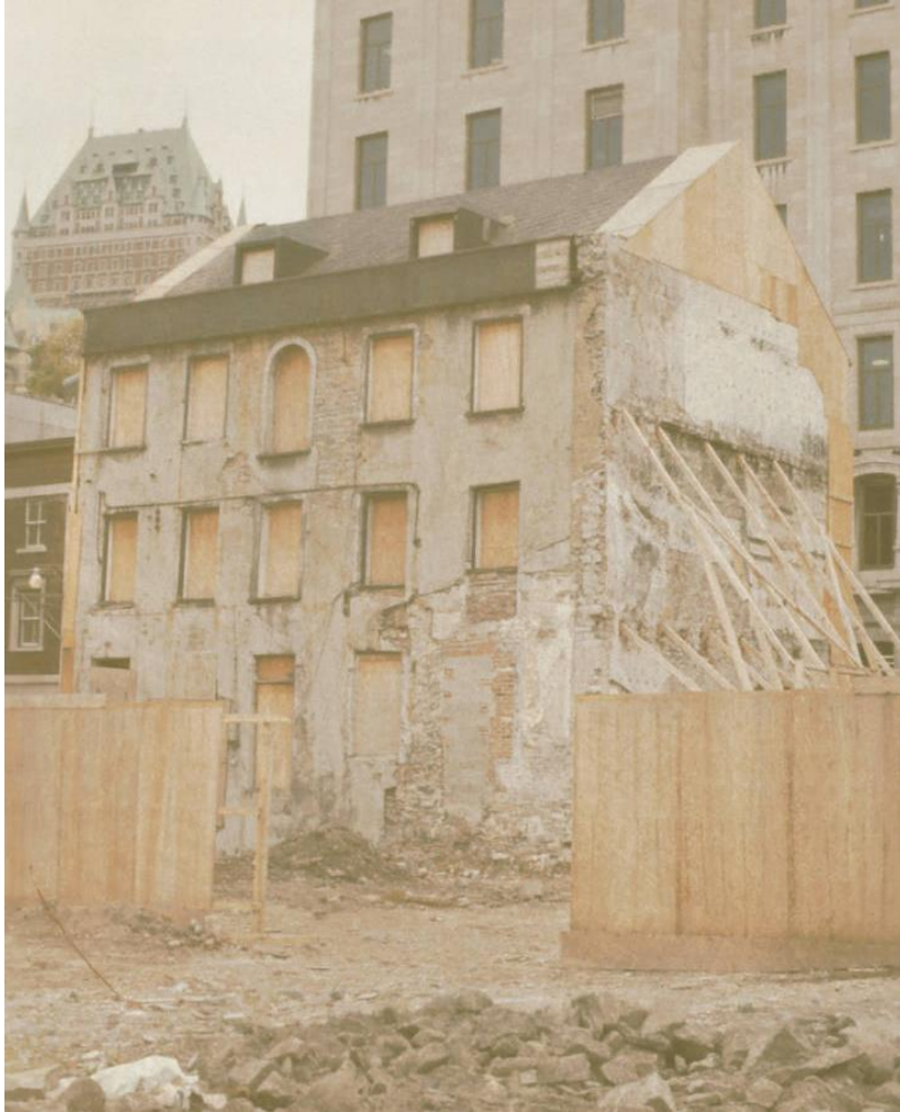
La maison de Quercy

En creusant les fondations du musée, on a évidemment trouvé des artefacts témoin des derniers temps de la Nouvelle-France, les anciens quais entre autres. La barque aujourd'hui exposée au creux du hall d'entrée se trouvait à cet endroit précis, semble-t-il.