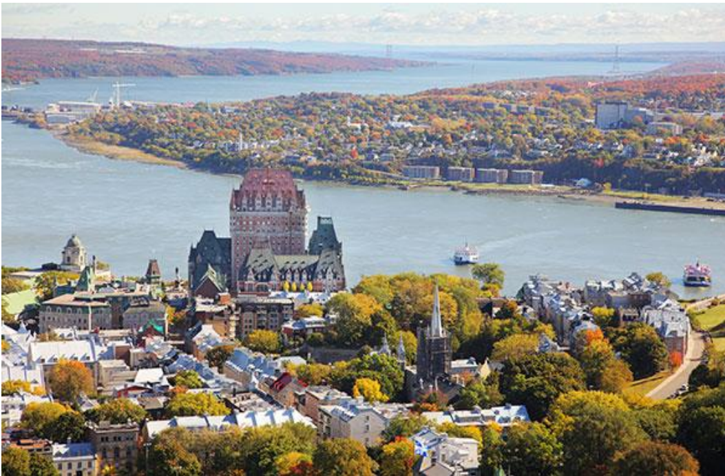
Le grand chemin serpentant vers la mer

Le 26 juin 1759, vous ne les voyez pas car ils sont ancrés à Saint-Laurent, de l'autre côté de l'île d'Orléans, mais ils sont bien là, les 186 vaisseaux anglais portant 9 000 soldats venus conquérir Québec. Ils vont passer devant nous pour se rendre à l'Anse des Mères. Le 13 septembre, avant midi, adieu Nouvelle-France.