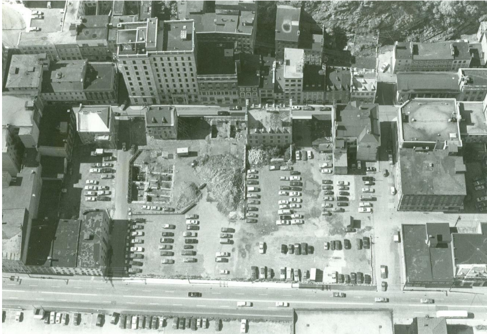
Années 1970

L'édifice Garneau disparu, il ne reste donc sur l'emplacement du futur Musée de la Civilisation, sur la rue Saint-Pierre, que la Maison Quercy, la Maison Estèbe et la Quebec Bank. Parking, parking, parking.