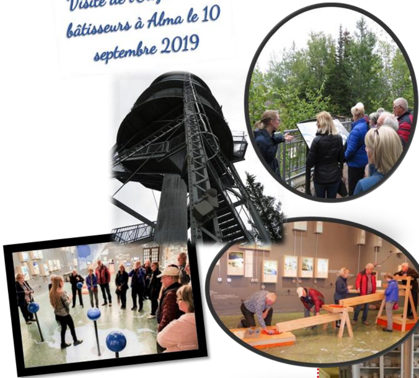
Visite de l'Odysée des bâtisseurs à Alma le 10 septembre 2019